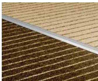
SEPARADOR CON QUICK-FIX®