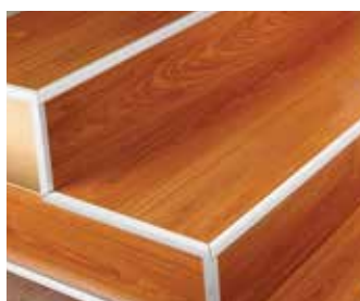
PERFIL DECO F