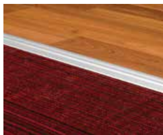
DESNIVEL CON QUICK-FIX®